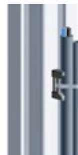
Kreuz-Kabelbinderblock Cross Cable Binding Block